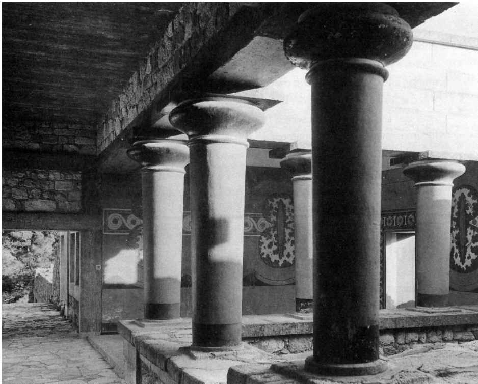
پلکان بزرگ کاخ کنوسوس به این محوطه منتهی می‌شود که باستان‌شناسان آن را «تالار نگهبانان» می‌نامند. دیوارنگاره‌های زیبا شامل نقش هشت سپر می‌شود.

مدارک باستان‌شناختی نشان می‌دهد که رشد نسبتاً سریع تمدن شکوهمند مینوسی کمی