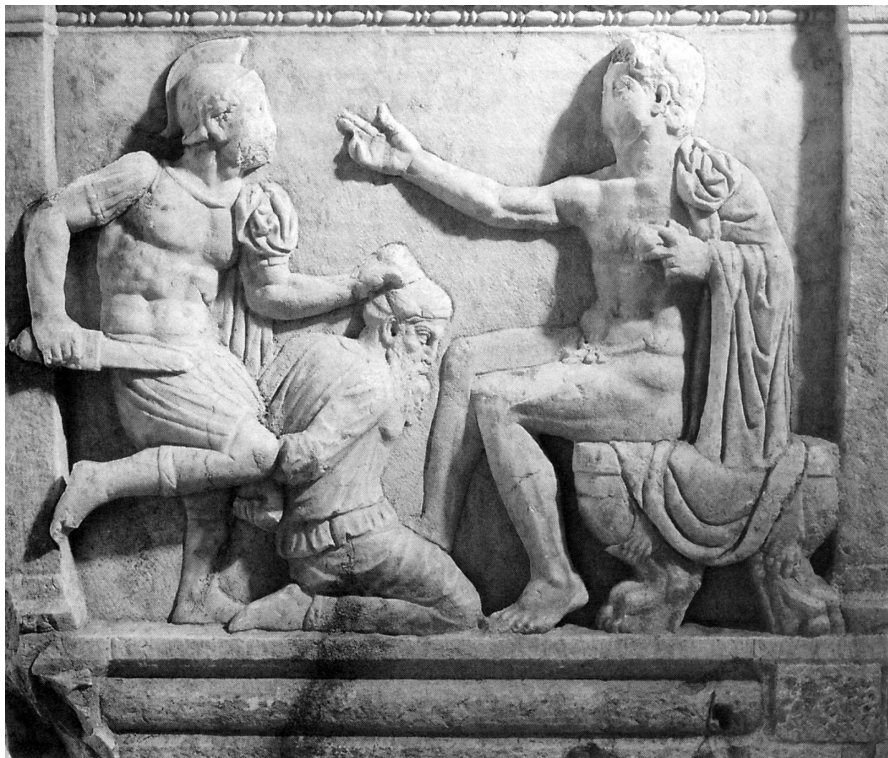
این صحنه از جنگ تروا در بدنهٔ تابوتی سنگی (سارکوفاغوس) حکاکی شده است. آن جنگ افسانه‌ای درون‌مایهٔ دلپسندی برای هنرمندان و نویسندگان بعدی یونانی بود.

علت یا علل این فاجعه هرچه باشد، تمدن یونانی ناگهان رو به زوال رفت و وارد نوعی عصر تاریک فرهنگی شد. کاخ‌های قدیمی که فرو ریخت، مردم بی‌سواد شدند و بسیاری از قابلیت‌های سیاسی و هنری خود را، که پشتیبان پادشاهی‌های عصر مفرغ بود، از دست دادند. اما همه چیز از دست نرفت، چراکه برخی از مهارت‌های تمدنی، به همراه خاطرات پراکنده قهرمانان بزرگ و دیگر نیاکانی که در روزگاری سعادت‌مندتر می‌زیستند، باقی ماند. چندین قرن طول کشید تا یونانیان، که به این خاطرات دل بسته بودند، کاملاً خود را بازیابند؛ اما دستاوردهای این بازیابی به موقع خود راهی تازه و جسورانه را پیش روی جهان غرب گشود.