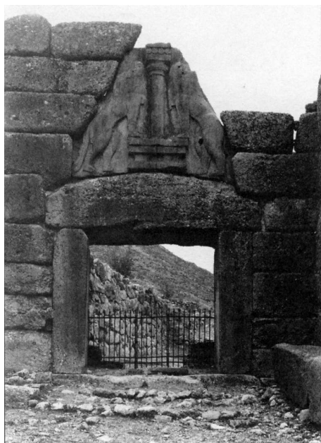
«دروازه شیر» مشهور در میسن، که به روی ویرانه‌های یک کاخ عصر مفرغ باز می‌شود.

دریافت این که میسنی‌ها یونانیان نخستین بوده‌اند بُعد دیگری نیز به رخدادی سرنوشت‌ساز و جالب توجه در تاریخشان افزود، رخدادی که در میان پژوهشگران از دیرباز موضوع مطالعه و بحث‌های داغ بوده است. موضوع بر سر احتمال ارتباط آن‌ها با افسانه مشهور جنگ تروا بود. داستان محاصره و غارت شهر پُرونق تروا از سوی اتحادیه‌ای از شاهان یونانی در ایلید، منظومه‌ای حماسی منتسب به هومر، شاعر افسانه‌ای یونانی قرن هشتم پیش از میلاد، بازگو شده است. (اودیسه، حماسه دیگر هومر، داستان ماجراهای یکی از این شاهان - اُدوسئوس (اودیسه) - را پس از خاتمه جنگ بازگو می‌کند.) پژوهشگران عصر جدید مدت‌ها گمان می‌کردند تروا و محاصره آن که هومر توصیف کرده افسانه‌ای بیش نیست. اما هاینریش شلیمان، که عقیده داشت تروا مکانی واقعی بوده، در سال ۱۸۷۰ با از زیر خاک درآوردن آن جهان را شگفت‌زده کرد. او در جایگاهی در شمال غربی آسیای صغیر (ترکیه کنونی) رشته شهرهایی را که روی یکدیگر بنا شده بودند کشف کرد و به این نتیجه رسید که ششمین شهر از پایین تروای هومر است.