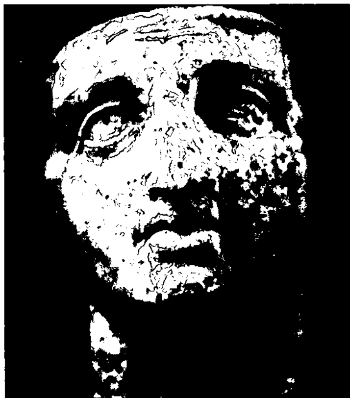
اسکندر کبیر: حکاکی روی عاج از مقبره سلطنتی ورگینا، مقدونیه

بررسی و تفحص در زندگی اسکندر، سفری دلفریب و مفتون کننده به تاریخ رهبری بود. با شگفتی بسیار متوجه شدم که با این سفر خاطراتم را نیز به یاد می‌آورم. یاد آمد هنگامی که کودکی بیش نبودم چگونه داستان گره گوردیوس ۱ مرا مجذوب و فریفته خود کرده بود، داستانی که در آن گرهی چنان کور وجود داشت که بنا بر افسانه‌ها هر کس آن را باز می‌کرد، حاکم