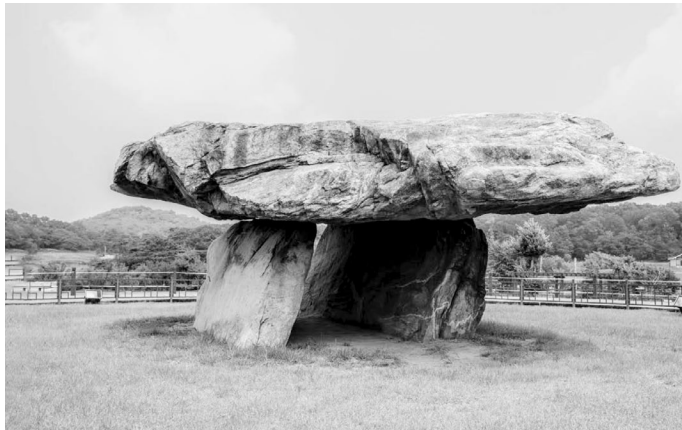
در کره، دُلْمَن‌ها را کوئیندول یا چیسونگمیو می‌نامند. این دلمن در عصر برنز در مونهونگ-ری، نه‌چندان دور از پیونگ‌یانگ امروزی در کره شمالی، ساخته شد.

سفال دیگر یافته مهم باستان‌شناسی است. استفاده از ظروف سفالی شیوه‌ای برای ذخیره و پخت غذا بود و سفالگری دوشادوش کشاورزی تحول یافت. سفال نگهداری مقادیر بیشتر غذا برای مدت‌زمان طولانی‌تر را ممکن ساخت، امنیت غذایی لازم را برای سکونت فراهم آورد و دیگر لازم نبود مردم در جستجوی منابع جدید غذا دایم جابه‌جا شوند. انسان‌ها از ناخن خود، صدف، تکه‌های چوب و استخوان برای تزئین نوع ابتدایی سفال که به سبک مومون معروف است استفاده می‌کردند. در عصر برنز، سبک ساده‌تری که از منچوری عاریت گرفته شده بود جای آن را گرفت. تحول سبک‌های مختلف سفالگری در سراسر تاریخ کره ادامه یافت.