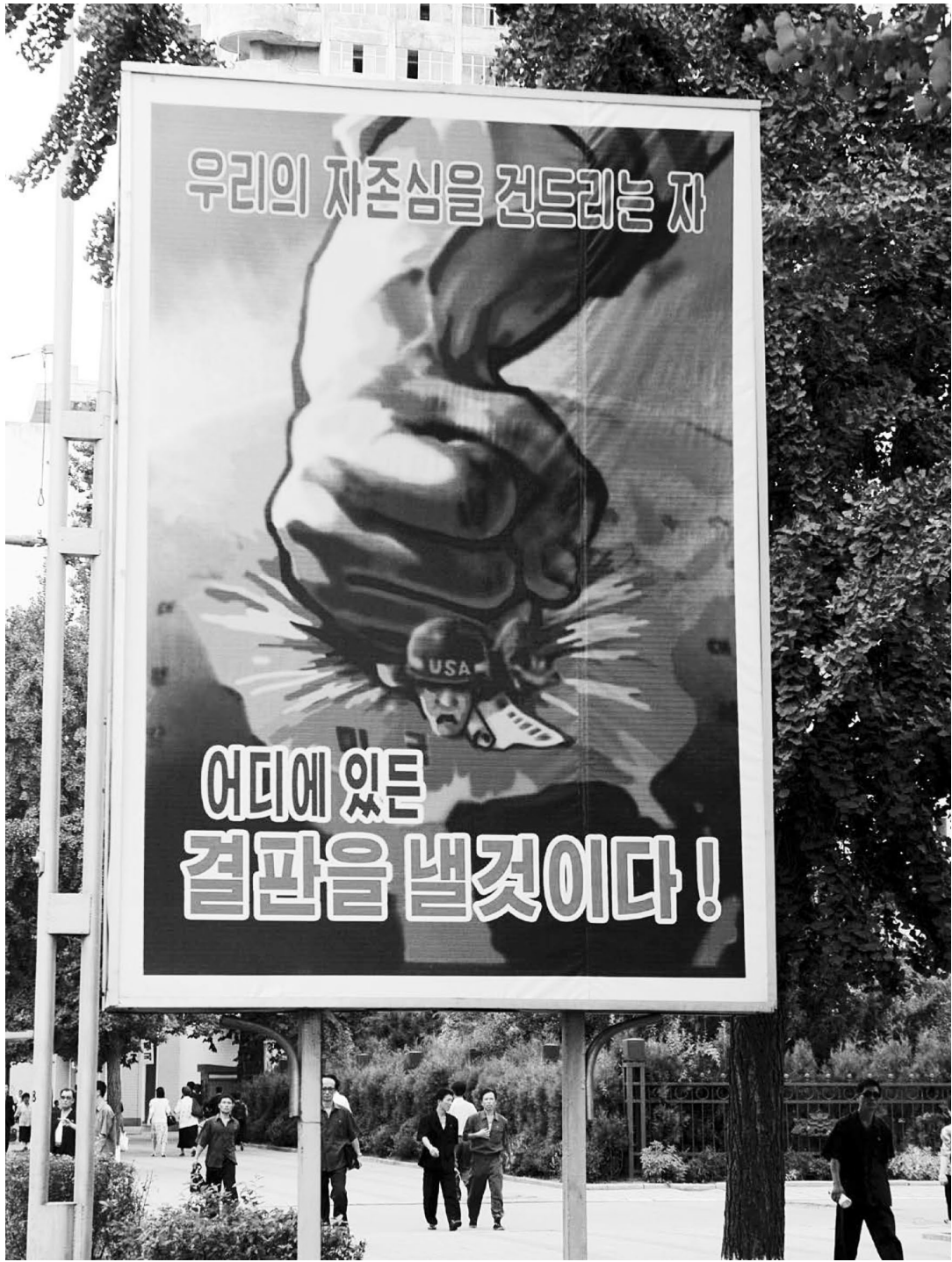
تبلیغات ضد آمریکایی را می توان در همه شهرها، مدارس و در هنر عمومی کره شمالی دید. ایالات متحده از دیرباز دشمن بزرگ مردم کره شمالی تلقی می شود.