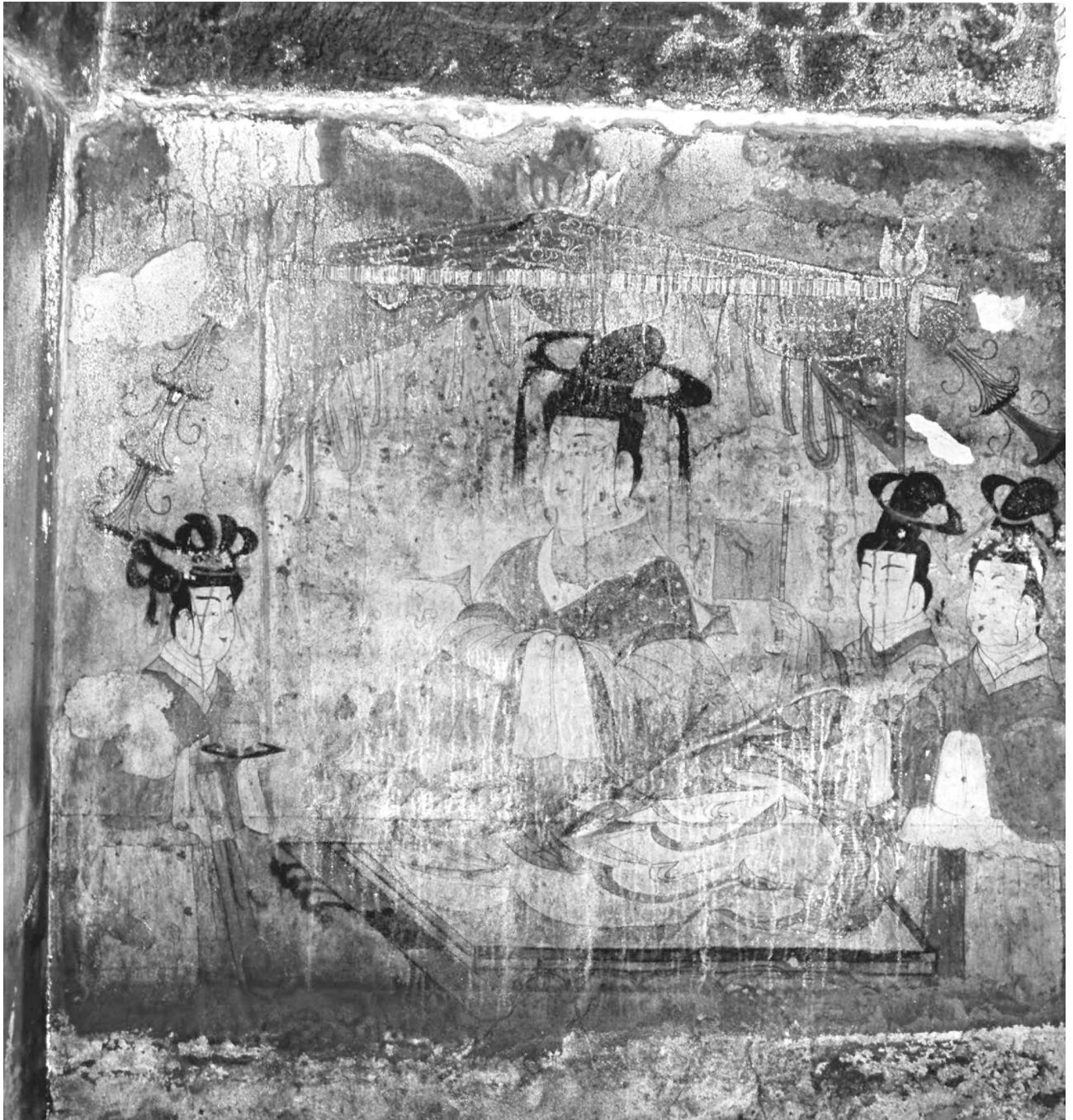
این نقاشی معبدی در نزدیکی پیونگ‌یانگ امروزی قرار دارد. در تصویر، قابلمه بزرگی از برنج در حال پختن است و افرادی در حال کار کردن در آشپزخانه دیده می‌شوند. در اطراف، تصاویر کجاوه و گوشت آویخته برای خشک شدن جزئیات بیشتری از زندگی روزانه در کورئو را نشان می‌دهد.