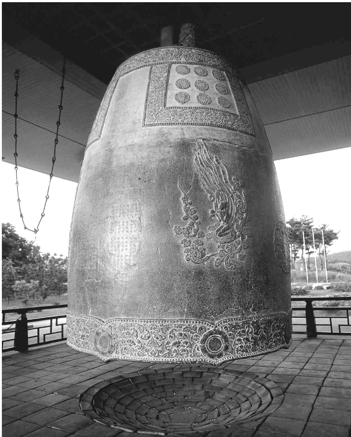
ناقوس شاه سونگدوک نمونه تأثیرگذاری از مهارت‌های صنعتگری سیلای متحد است. این ناقوس برنزی به وزن تقریباً ۱۹ تن در سال ۷۷۱ م ساخته و با اشکال بودایی و نقوش چینی آراسته شده است.